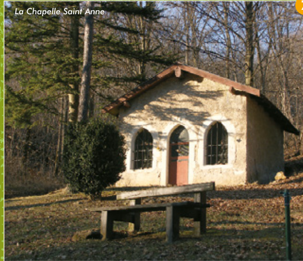
La Chapelle Saint Anne

9 L'anémone pulsatile est une plante vivace des endroits calcaires ; elle appartient à la famille des renonculacées. Ne dépassant pas 30 cm de haut, de couleur violet pourpre, cette plante fleurit d'avril à juin. Elle est protégée et toxique