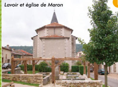
Lavoir et église de Maron

8 Tranchée Marie Chanois : chemin empierré desservant la forêt domaniale de Haye, à l'origine occupée par le chêne (anciennement « Chanois »), accolé au mot mer-rain (pièce de bois incurvée en chêne servant à la fabrication des tonneaux).