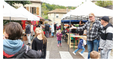
Le marché des producteurs était attendu à Viterne.

provenant d'exploitations locales. Les stands artisanaux et l'affûteur ont attiré le public. ■