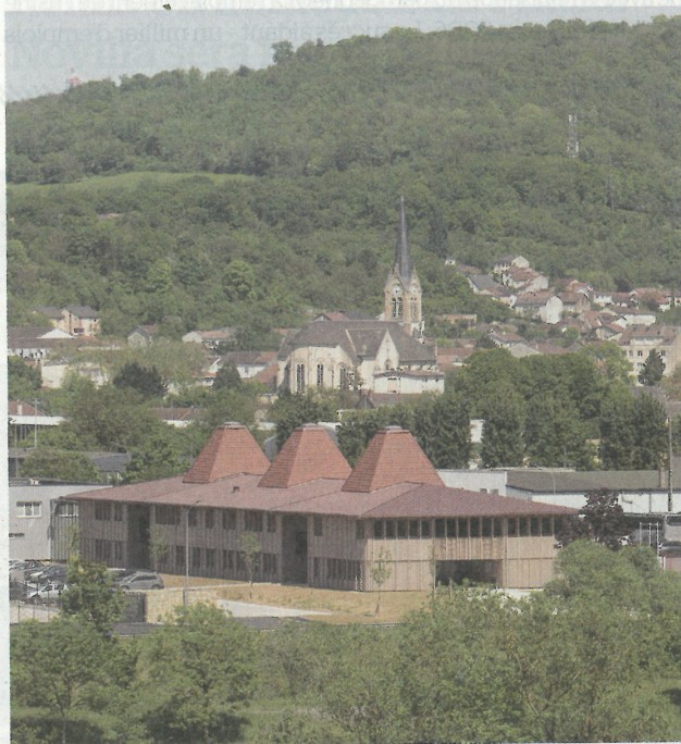
La halle est coiffée d'une toiture de tuiles rouges d'où émergent des puits de lumière caractéristiques de l'habitat rural lorrain.

L'ambition environnementale du programme se double de la volonté d'ériger une architecture « signal » : le bâtiment s'apparente à une vaste halle habillée de bois et rehaussée par une toiture de tuiles rouges d'où émergent trois édicules reprenant les codes