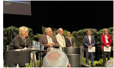
Le maire a mis en avant le travail de son équipe municipale.

fourni pour l'aboutissement de ce beau projet. ■