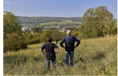
C'est sur ces prairies qu'un important lotissement était prévu.

la MRAe (Mission régionale d'autorité environnementale) relevant pour sa part l'impact du projet sur diverses espèces, dont le crapaud calamite, le crapaud commun ou encore le lézard des murailles. Finalement, ce projet de lotissement a été abandonné : seules quelques habitations verront le jour à Chaligny. ■