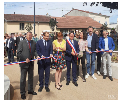
Le traditionnel ruban a été coupé, et l'Esplanade officialisée.