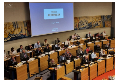
Une trentaine de délibérations étaient à l'ordre du jour ce jeudi au siège du conseil Métropolitain à Nancy.

Les priorités pour ces quatre prochaines années ? Favoriser un accès à la santé pour tous, promouvoir la santé et les démarches de prévention, développer des projets de collaboration entre les acteurs de la ville et la psychiatrie et contribuer au développement d'un environnement favorable à la santé. ■