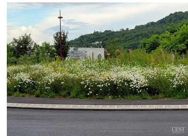
Les marguerites sont bien installées sur le rond-point : la comcom pratique la tonte différenciée.

toujours une surprise. » Et un plus pour la planète ! ■