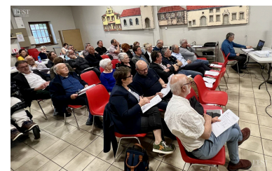
Le conseil communautaire de la CCMM a adopté à l'unanimité une Motion sur le traitement des nouvelles sources de pollution de l'eau potable.

La motion a été adoptée à l'unanimité par le conseil communautaire et autorise ainsi le président à engager toutes les démarches nécessaires en lien avec cette motion et à signer tout document afférent à cette délibération. ■