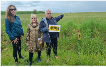
Quelques membres du collectif à côté du terrain herbeux qui fait partie du projet d'extension demandé par Carrières et Matériaux du Nord Est.